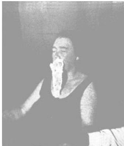
Foto nº 13. La fotografía nº 11, tirada desde otro ángulo, de acuerdo con la