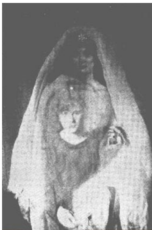
Foto 1. Extraordinaria fotografía espírita recogida entre las que ilustran el libro Spirit Photography , del mayor Tom Patterson.

Encontramos oportuno recordar el caso, haciendo un resumen de la historia de las apariciones de Katie King, pero como ya tenemos una, magníficamente realizada por el ingeniero Gabriel Delanne en su obra El alma es inmortal , vamos a transcribirla tal cual.