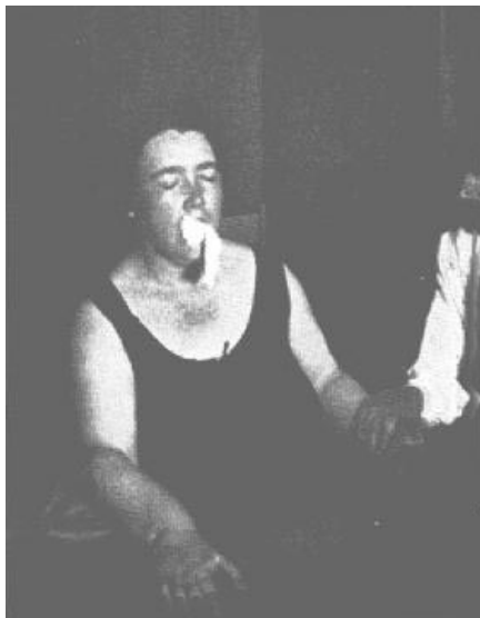
Foto nº 17. Otra formación de masa ectoplásmica mediante la misma médium.

Concluimos que el análisis del caso en cuestión nos autoriza a pensar que, en principio, es muy probable que las materializaciones minúsculas de caras y de espíritus constituyen simples simulacros (del mismo modo que varias fotografías trascendentales), sin embargo son simulacros proyectados y materializados por la voluntad de las personalidades mediúmnicas que operan y que, en ciertos casos, son las personalidades de los difuntos representados en esas formas.