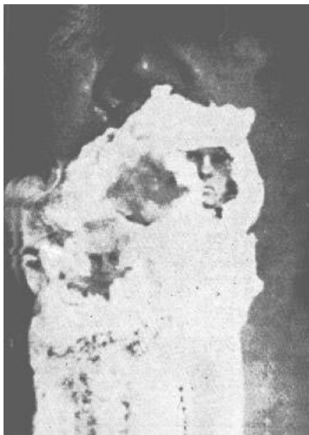
Foto nº 14. Excelente ampliación de la fotografía nº 11 mostrando dos caras de personas bien conocidas en vida, una de Raymond, el hijo de Sir Olivier Lodge, y la otra de un joven cuyo nombre no se quiso divulgar.

Es cierto que gran número de investigadores eminentes en el área de las indagaciones psíquicas, se han propuesto ignorar u ocultar el rasgo característico de naturaleza subjetiva que siempre está asociado a la emisión de ectoplasma. Esta actitud fue muy positiva al principio, en el período transitorio inicial donde se intentaba sobre todo comprobar la realidad de los fenómenos, pero, en la actualidad, ha llegado el momento en que podemos y debemos analizar los hechos en su conjunto, es decir, tomando seriamente en consideración la circunstancia de la