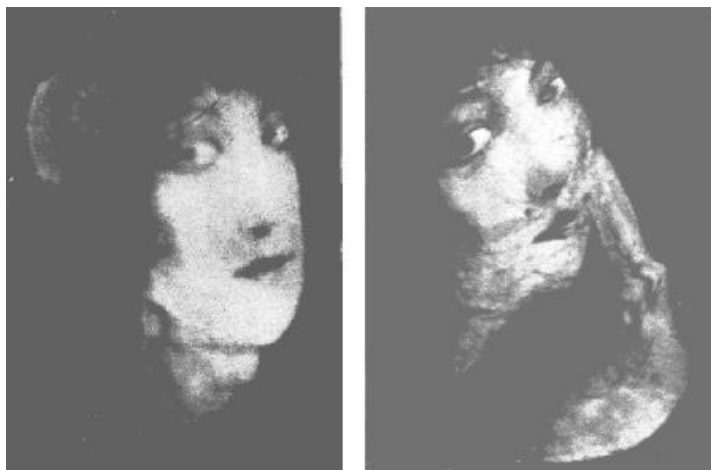
Fotos nº 5 y 6. Ampliación de los rostros de dos de las materializaciones minúsculas obtenidas en las sesiones.

Todavía no llegó el momento de comparar las consideraciones de la Sra. Bisson con las nuestras. En efecto, los procesos de análisis comparativo, aplicados a algunos de los casos que tratamos, podrán permitirnos sólo descubrir algún fundamento inductivo legítimo para la solución del problema. Me limitaré, por tanto, a insistir en el hecho de las exactas condiciones experimentales dentro de las que el fenómeno se produjo. Hay que destacar que el ideal de los metapsíquicos fue siempre el de obtener fenómenos físicos a plena luz del día y que, en esta ocasión, se alcanzó el objetivo deseado.