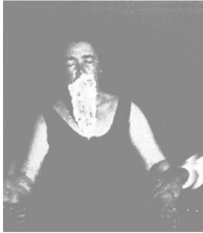
Foto nº 12. La misma fotografía nº 11 mostrando a la médium asegurada por ambos brazos.