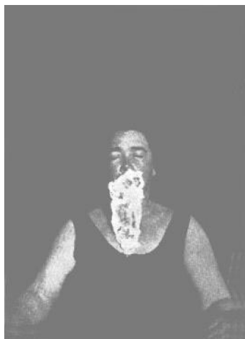
Foto nº 11. Otra abundante emisión de masa ectoplásmica, mostrando varias caras minúsculas de personas muertas, que fueron reconocidas.

Estas delicadas miniaturas, que no alcanzan un tercio de la cara de la médium, son perfectas en sus trazos y parecen vivas, suponen para los investigadores una fuente inagotable de estudios de maravillas. Gracias al relieve que las sombras proporcionan a los trazos de la figura así como el hecho de la incidencia producida por la luz en las pupilas de los ojos (como se observa en las fotografías tomadas en ángulo diferente), se obtiene una excelente prueba de su formación en tres dimensiones.