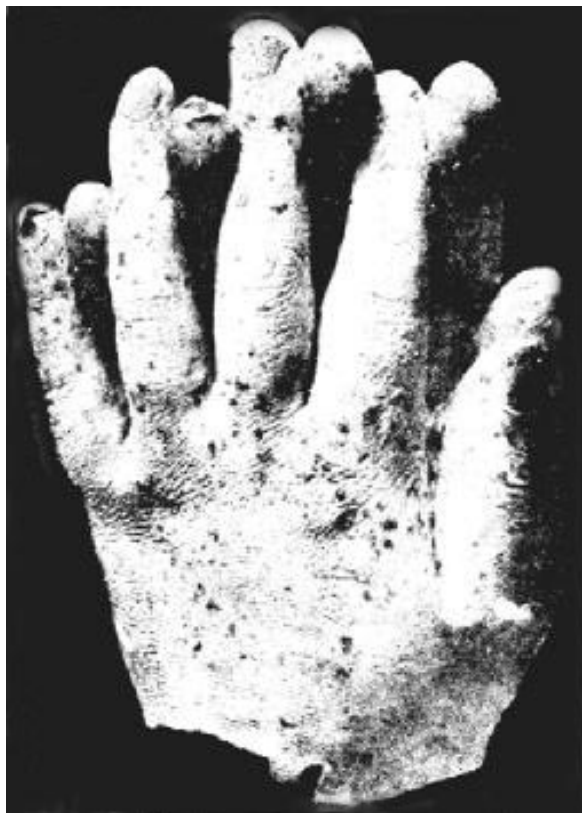
Foto nº 21. Un par de guantes de parafina con los dedos de las manos entrecruzados, mostrando granos de colorante colocados en la cera, para mejor autenticación.